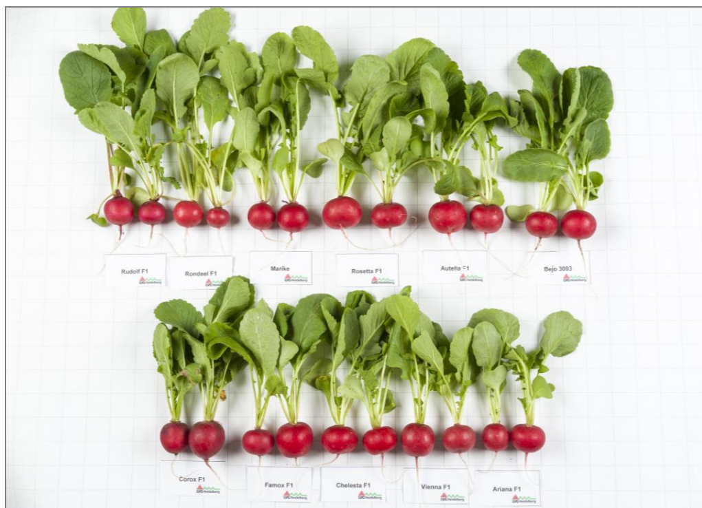
Abb. 3: Elf verschiedene Radies-Sorten für den ökologischen Anbau im kalten Folienhaus im Vergleich – Frühjahr 2016.