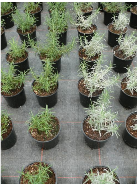
Abb. 6: Zwei Reihen der Variante „Prev“ links, zwei Reihen der Kontrollvariante rechts (KW 41)

Die Blockspritzung mit Vi-Care und Prev führte zu einem sichtbaren Befallsrückgang (Abb. 5). Dabei konnte vor allem durch die Behandlungen mit Prev die Anzahl der Töpfe mit Echtem Mehltau deutlich bis unter 10 % reduziert werden. Nach ca. zwei Wochen war wieder eine Befallszunahme zu registrieren, so dass eine weitere Blockspritzung in KW 41 folgte. Hierdurch konnte in beiden Varianten ein wiederholter Befallsrückgang erzielt werden.