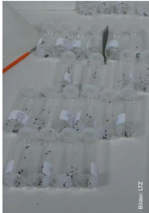
Bild 1 Gläschen mit Test-Substanz und Rapsglanzkäfer

An 15 verschiedenen Landratsämtern werden die Tests seit mehreren Jahren durchgeführt. Für die Methode der „Adult-Vial-Tests“ (AVT) werden Rapsglanzkäfer im Feld gesammelt und jeweils zehn Käfer in Gläschen mit unterschiedlichen Konzentrationen der